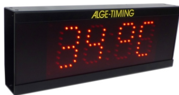
80 mm Ziffernhöhe, 4-stellige Anzeigetafel (Standardausführung), rote LEDs, abwechselnde Anzeige von Temperatur und Tageszeit