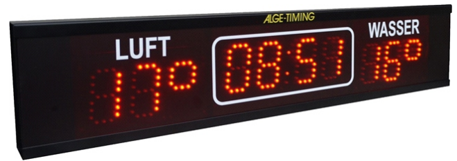
80 mm Ziffernhöhe mit roten LEDs, Anzeige der Luft-/Wassertemperatur sowie der Tageszeit