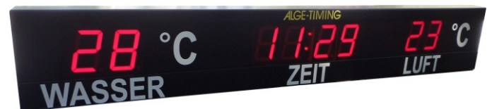
57 mm Ziffernhöhe (7-Segment LEDs), einzeilige Anzeigetafel mit Anzeige der Tageszeit sowie der Wasser- und Lufttemperatur