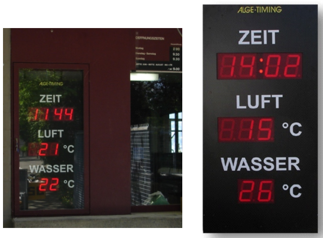
100 mm Ziffernhöhe (7-Segment LEDs), Spezialgehäuse für Einbau in bestehende Aussparung, Anzeige von Luft-/Wassertemperatur und Tageszeit