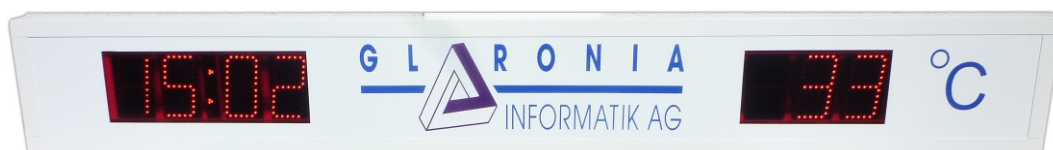
150 mm Ziffernhöhe, weisses Gehäuse mit weissem Plexiglas und Firmenlogo, links Anzeige der Tageszeit, rechts Anzeige der Lufttemperatur