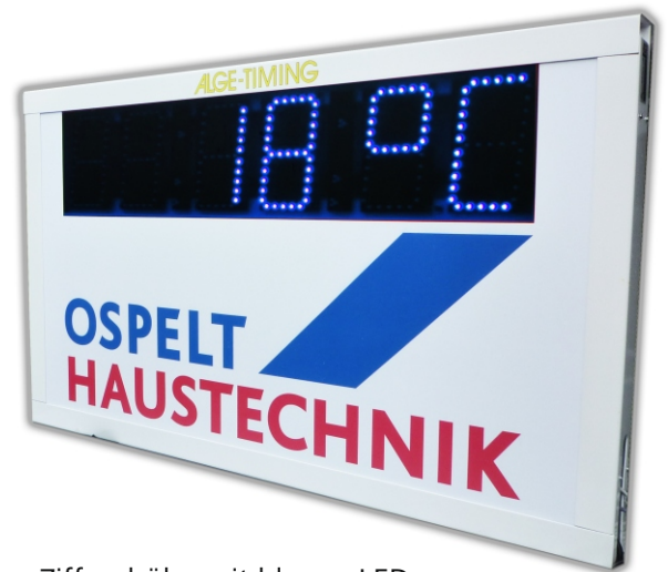
150 mm Ziffernhöhe mit blauen LEDs, weisses Gehäuse mit weissem Plexiglas und Firmenlogo, abwechselnde Anzeige von Temperatur und Tageszeit