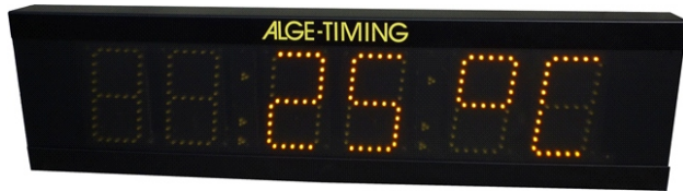
150 mm Ziffernhöhe mit gelben LEDs, abwechselnde Anzeige von Temperatur und Tageszeit

Nachfolgend stellen wir eine kleine Auswahl der Projekte vor, welche wir zusammen mit unseren Kunden umgesetzt haben.